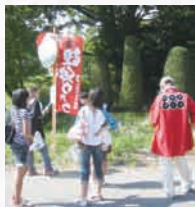
5分間隔でスタートします。

1班 5～6名 コースマップと解答用紙（スコアカード） を持って、ゴール予定時間を決めてス タートします。（所定の時間より1分早く ても遅くても1点 減点となります。） 途中8ヶ所のポイントと、住民 に聞いて答える設問が2ヶ所 用意されています。出題数は 各設問ごと4択式の5問で、全 部で50問です。（1問2点で、 100点満点です。）