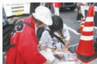
ゴールをしたら、正解を聞いて採点になります。

3kmコースが6コース、スタート地点への移 動と、ゴール後の答え 合わせと解説までを 含めて、2時間30分 位です。（コースの距 離、時間は、ご要望に 応じて設定できます。）