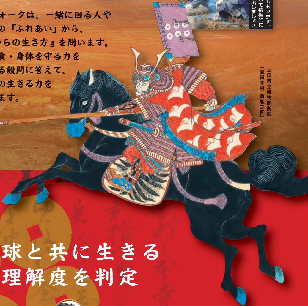
上田市立博物館所蔵 「真田幸村 勇戦之図」