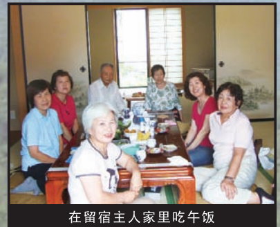
在留宿主人家里吃午饭