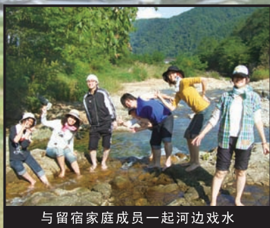
与留宿家庭成员一起河边戏水