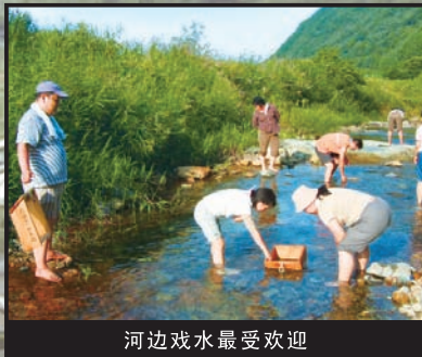
河边戏水最受欢迎