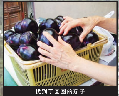
找到了圆圆的茄子