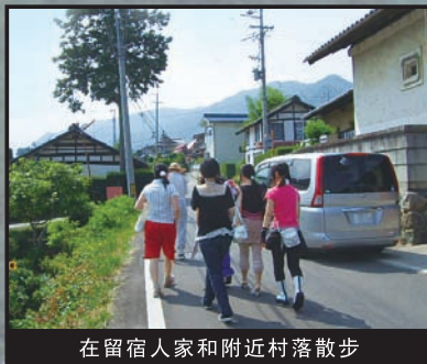
在留宿人家和附近村落散步