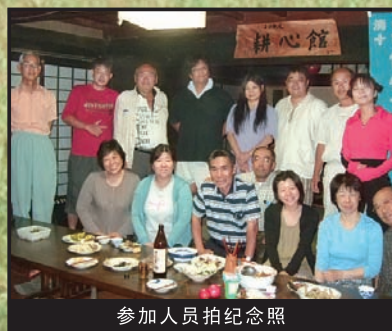
参加人员拍纪念照