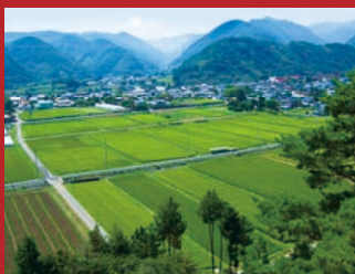
为您展开一派恬静的田园风光