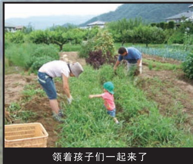
领着孩子们一起来了