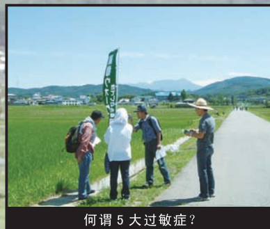
何谓 5 大过敏症？