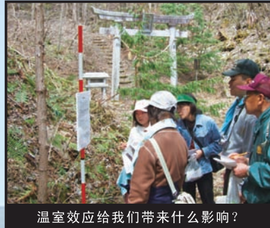
温室效应给我们带来什么影响？