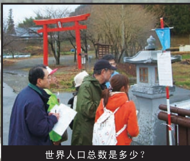
世界人口总数是多少？