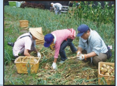
享受收获蔬菜的快乐