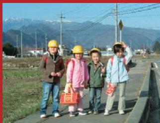
在大自然中成长的孩子们