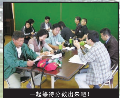
一起等待分数出来吧！