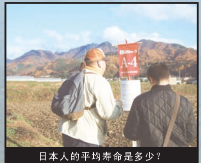
日本人的平均寿命是多少？