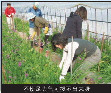
不使足力气可拔不出来呀