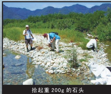
拾起重 200g 的石头