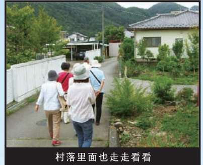
村落里面也走走看看